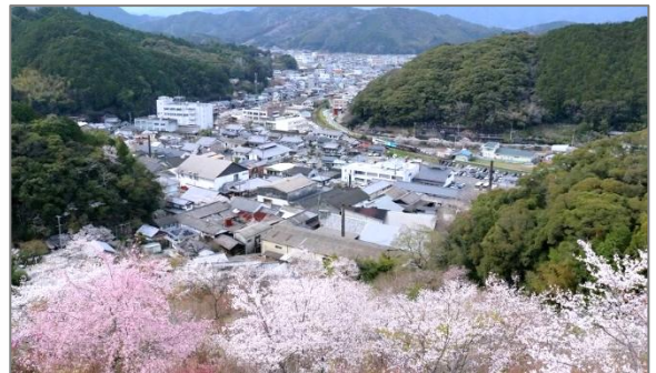
桜の季節「牧野公園」から街並みを望む

平成2年、由留岐橋が新しくなったとき「渡り初め」の儀式に、私の両親、弟夫婦、孫夫婦の三代が選ばれました。後日、神官の後に厳かに新橋を渡っている写真を父が送ってくれました。今も私の机の前に飾ってある写真を見ながら亡き両親を忍び、貴重な機会を与えて頂き良かったなあ！と改めて嬉しく思っています。しかし、立派な橋は出来ましたが、当時青々と多くの水を湛えていた川も今は随分水量が減り、子供達の声も聞くことがなくなり、かつての賑わいはありません。